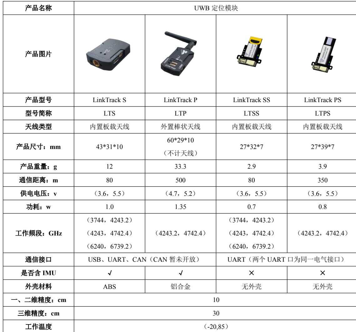
表 1: LinkTrack 型号参数表

LinkTrack 有不同 4 种型号产品，主要差异为通信距离、尺寸、是否带外壳，详细信息请参考表 1。