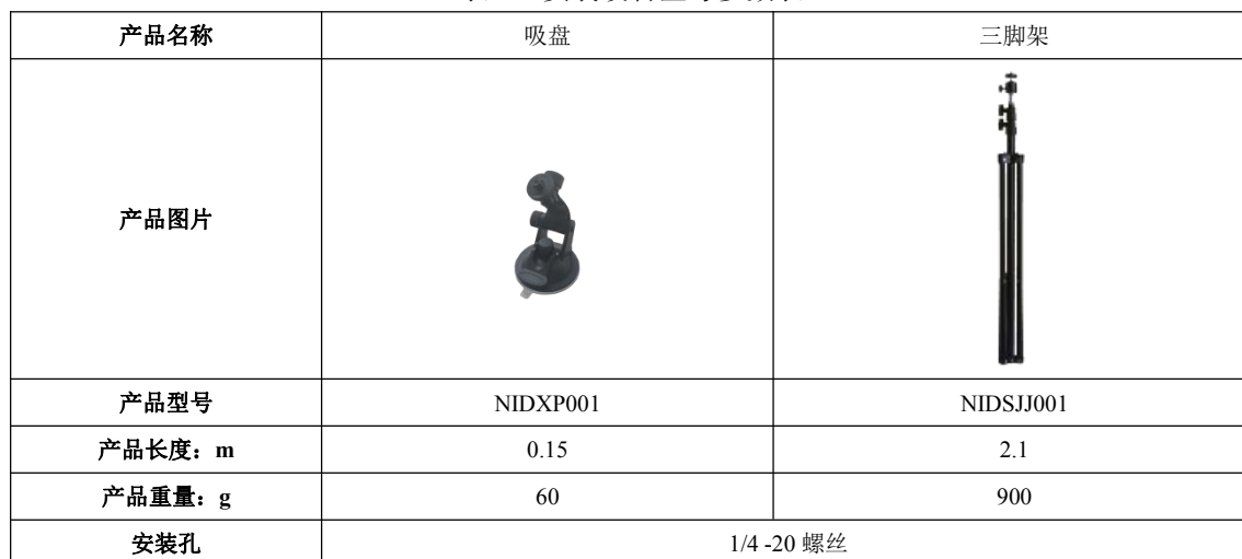
表 4: 安装设备型号参数表

LTS、LTP 均有 1/4-20 螺母安装孔，可安装在具备 1/4-20 螺丝的设备上，详细信息请参考表 4。