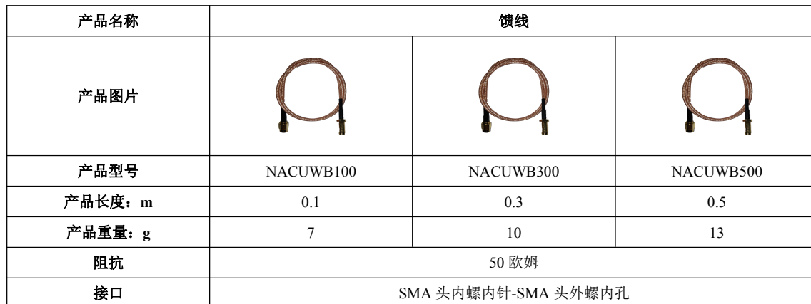
表 3: 馈线型号参数表

当天线与 UWB 模块需要分开放置时，可通过馈线连接 UWB 模块与天线，详细信息请参考表 3。