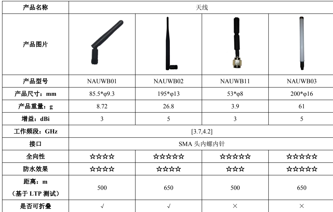
表 2: 天线型号参数表

LTP 可接外置天线，接口为 SMA 外螺内孔，因此可以根据实际使用场景选择更加合适的天线型号，详细信息请参考表 2。